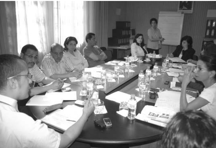
ورشة التحسيس في لقاء 7 يوليوز 2006