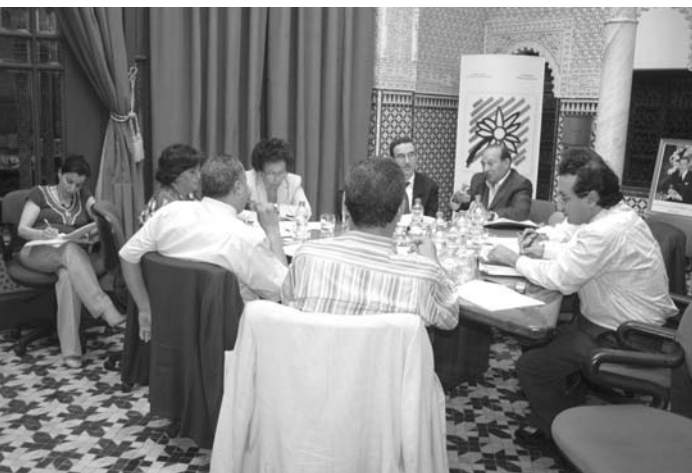
ورشة تكوين المهنيين في لقاء 7 يوليوز 2006