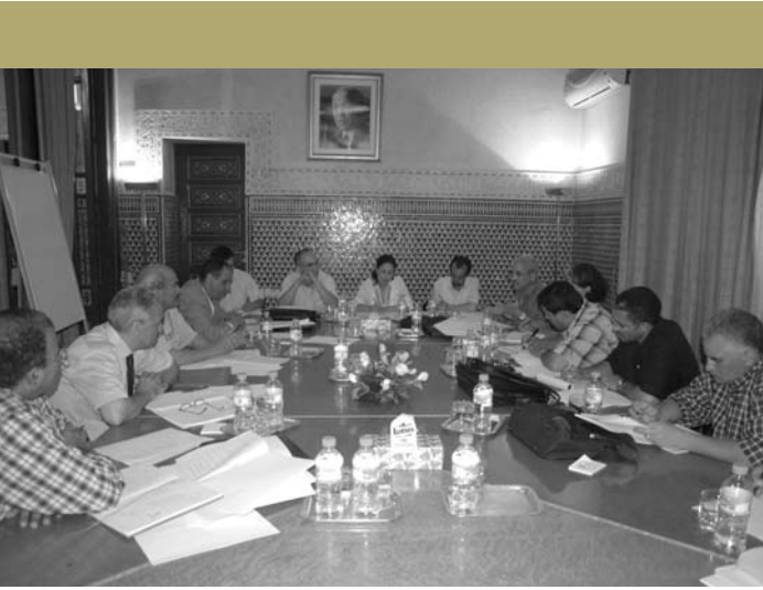
ورشة التربية في لقاء 7 يوليوز 2006